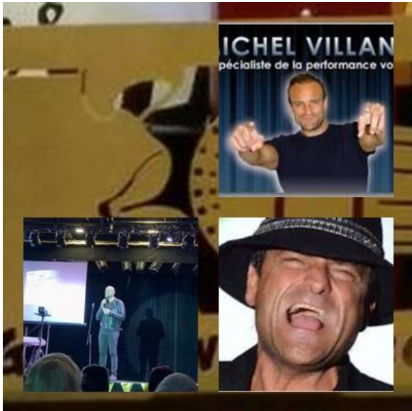
Michelle Villano le chanteur au 100 voix