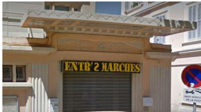
La salle des Mutilées