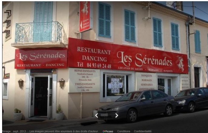
l'image - sept. 2013 - Les images peuvent être soumises à des droits d'auteur - © Pizzzo - Conditions - Confidentialité